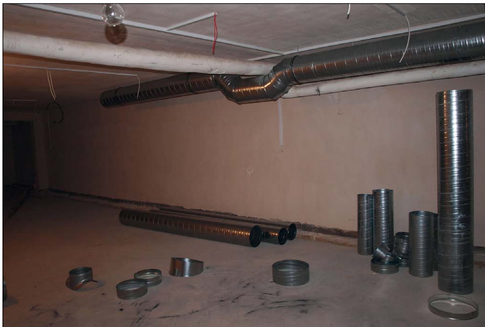
Ryc. 11. Wnętrze magazynu archeologicznego podczas drugiego etapu prac dofinansowanych przez MKiDN, wg stanu z 9 grudnia 2015 r.