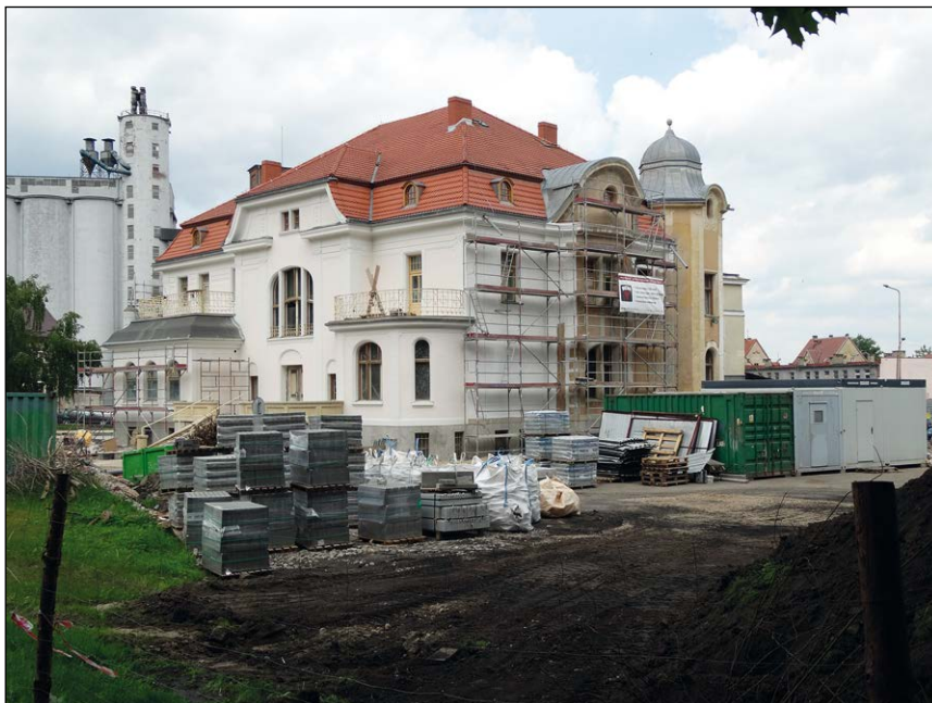
Ryc. 1. Młodzieżowy Dom Kultury przy ul. Portowej w Stargardzie podczas prac remontowych w latach 2014/2015, wg stanu z 13 maja 2015 r.