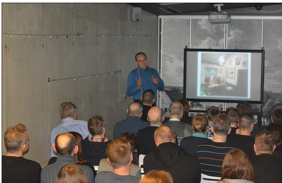
Ryc. 10. Prelekcja pt. II wojna światowa na fotografiach niemieckich żołnierzy z 25. Pułku Grenadierów ze Stargardu. Ze zbiorów Heimathaus-Stargard w Elmshorn (w ramach cyklu „Muzealne Spotkania z Przyszłością”), Basteja, 26 lutego 2015 r.