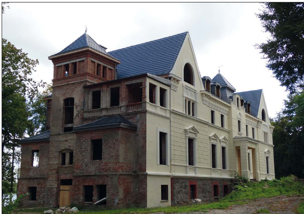
Ryc. 9. Pałac w Bytowie podczas prac renowacyjnych rozpoczętych w 2014 r., wg stanu z 30 września 2015 r.