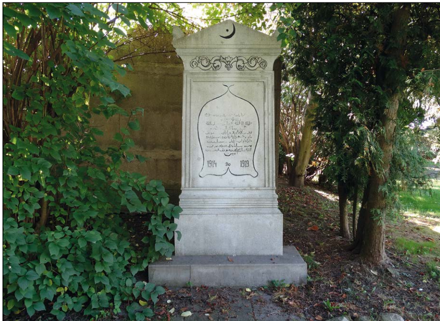
Ryc. 13. Pomnik poświęcony wyznawcom islamu, żołnierzom armii rosyjskiej, którzy zmarli w obozie jenieckim w Stargardzie w latach 1914-1919 i spoczęli na obecnym Międzynarodowym Cmentarzu Wojennym przy ul. Władysława Reymonta w Stargardzie, wg stanu z 19 września 2015 r.