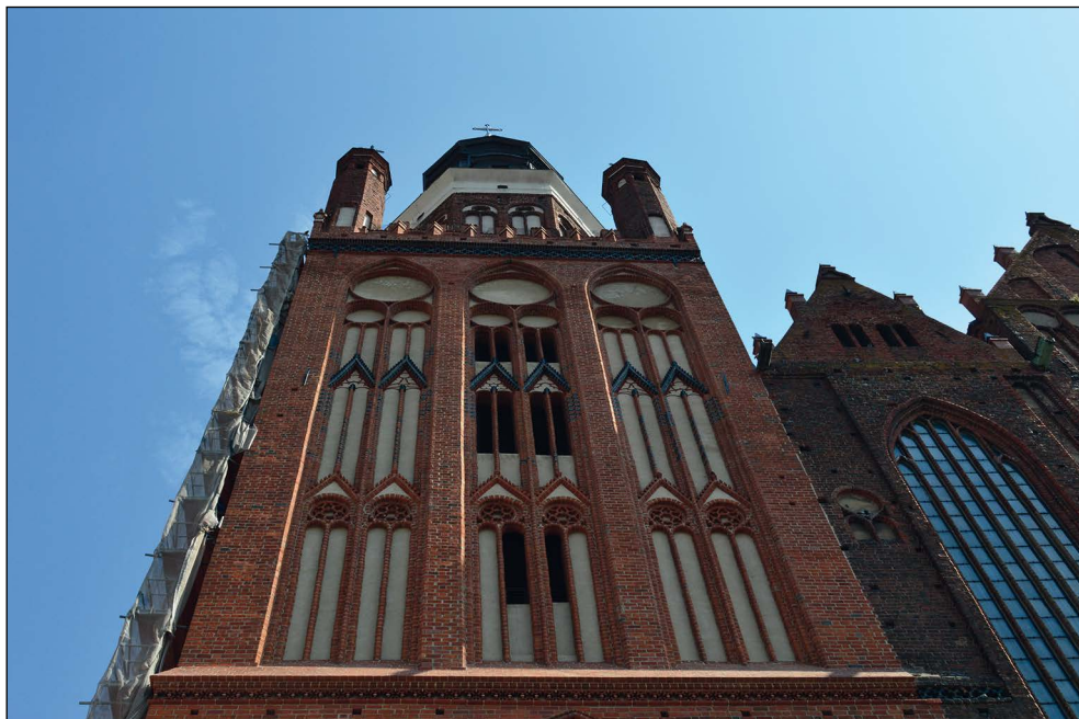
Ryc. 3. Remont wieży północnej kościoła Mariackiego w Stargardzie, wg stanu z 6 lipca 2015 r.