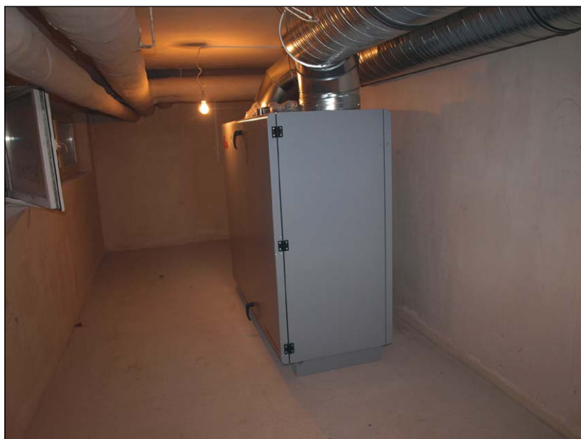
Ryc. 12. Centrala z filtrami instalacji nawiewno-wywiewnej zamontowana w magazynie archeologicznym w trakcie drugiego etapu prac dofinansowanych przez MKiDN, wg stanu z 9 grudnia 2015 r.