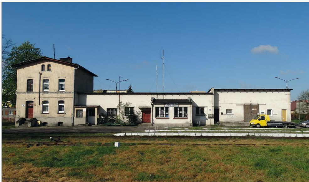
Ryc. 5. Zespół budynków dawnej stacji kolej wąskotorowej w Stargardzie (widok od ul. Rzeźniczej), wg stanu z 29 kwietnia 2015 r.