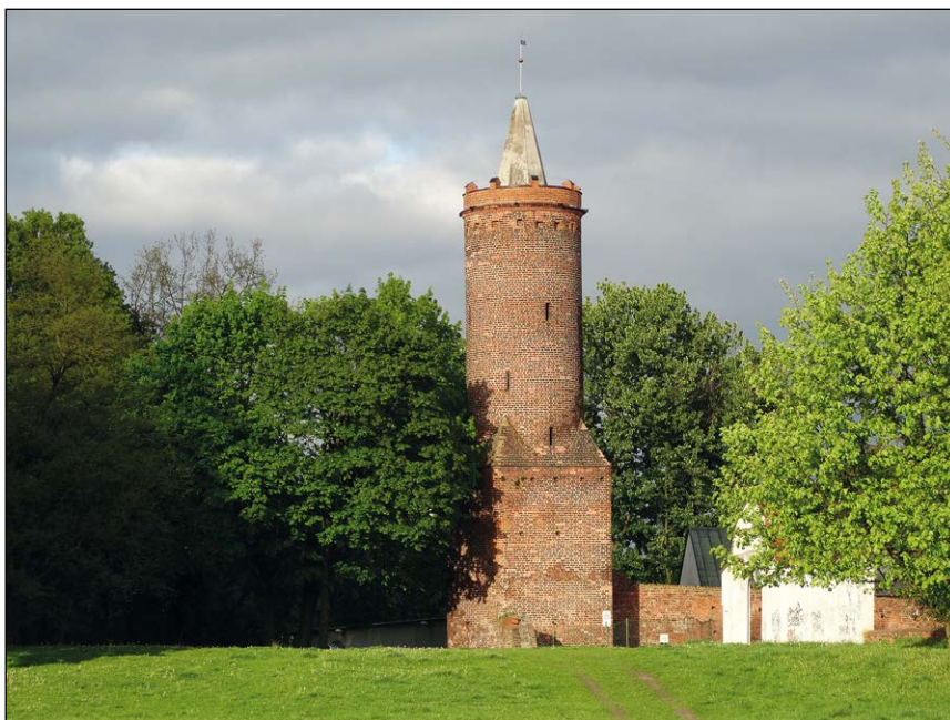
Ryc. 2. Baszta Białogłównka, widok od strony północno-zachodniej, wg stanu z 10 maja 2015 r.