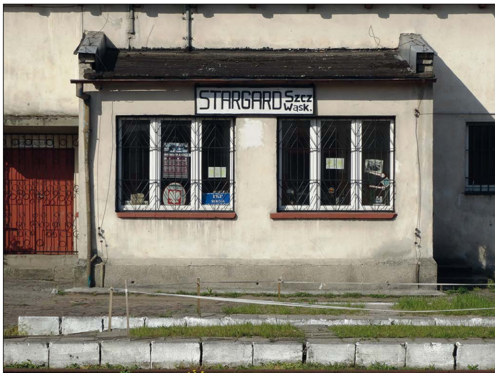
Ryc. 6. Budynek dawnej stacji kolei wąskotorowej w Stargardzie (widok od ul. Rzeźniczej), wg stanu z 29 kwietnia 2015 r. Fot. A. Bierca, MAH w Stargardzie