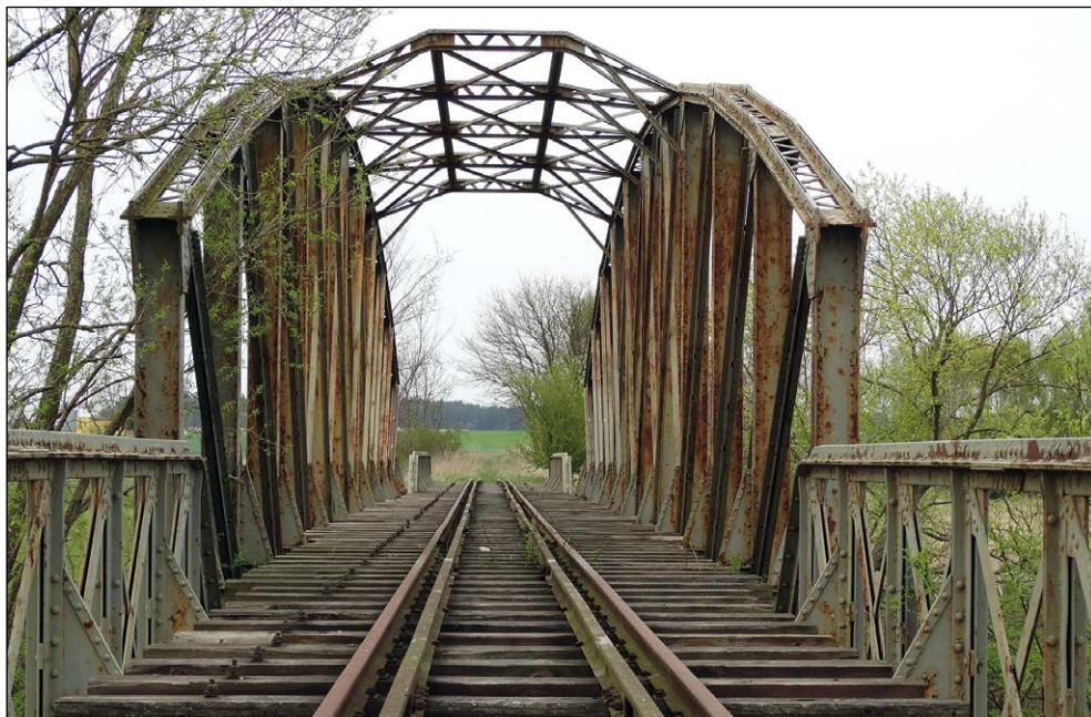
Ryc. 7. Most kolei wąskotorowej na rzece Inie pod Lubowem z około 1895 r., wg stanu z 24 kwietnia 2015 r.