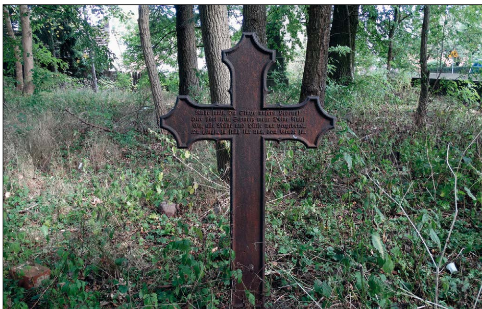
Ryc. 8. Nagrobny krzyż żeliwny na dawnym cmentarzu ewangelickim w Błotnie (gm. Dobrzany, pow. stargardzki), wg stanu z 30 września 2015 r.